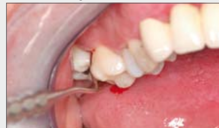
2 | Sondierung der Furkation