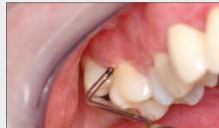
1 | Sondierung des Knochendefektes