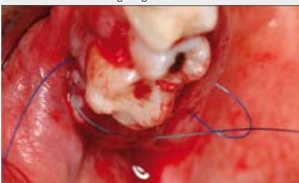
7 | Technik Nahtverschluss