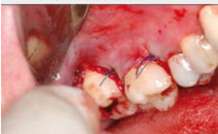
8 | Zustand nach Nahtverschluss

Die Patienten sollten nach der Operation für 1-2 Tage zu Hause bleiben und Kühlen, am besten mit feucht-kalten Umschlägen (Waschlappen) oder Gelkissen, die im Kühlschrank (nicht im Tiefkühlschrank!) vorbereitet wurden. Antibiotika, die wegen der Anwesenheit parodontaler Leitkeime verordnet wurden, müssen u. U. insgesamt für 10 Tage weiter eingenommen werden! Wegen der multiplen Nähte sollten die Patienten in den ersten Tagen nach der OP wenig sprechen.