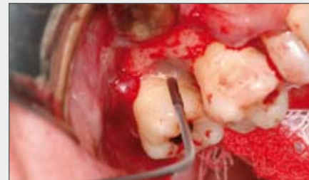
4 | GTR mit Schmelz-Matrix-Protein