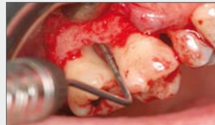
3 | Operative Darstellung