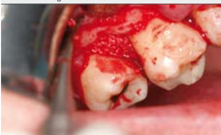
6 | Vollständig augmentierter Defekt