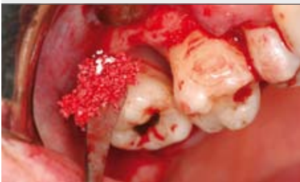
5 | Augmentation